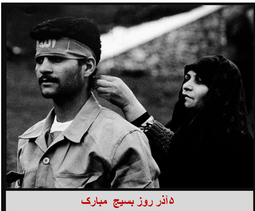
۵ آذر روز بسیج مبارک